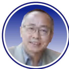
陈安均 教授 美国硅谷公平健康系统研究所 Professor Chen Anjun Institute for Equitable Health Systems, Silicon Valley, USA