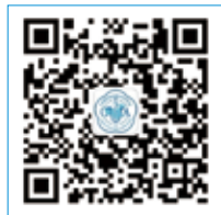
中华医学会泌尿外科学分会 公众号二维码