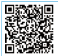
结石护理会议 直播二维码

学分证书： 正式注册代表可观看全部学术内容，观看达到4小时且完成线上考核，可获得国家级继续医学教育学分，项目编号：2022-04-05-004(国)。